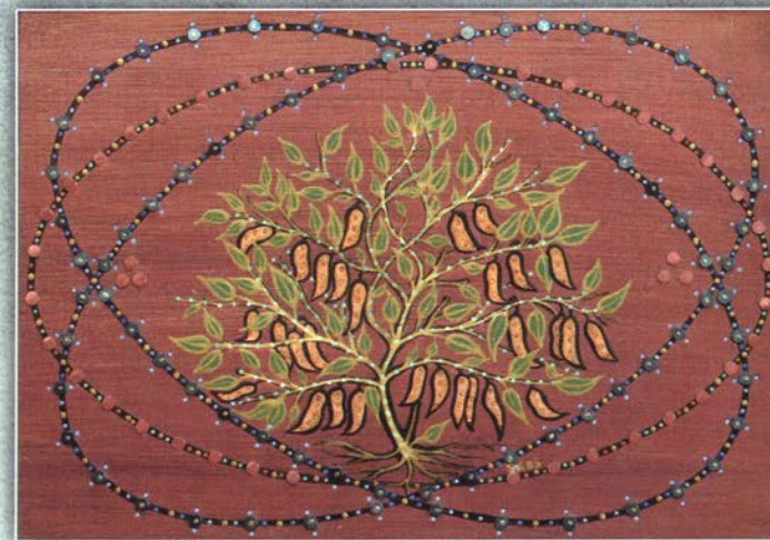
„Боб” - “Bean plant” Дърво, акрил, метални пулове, кристали, 2006 г., 32 x 22 см Wood, acrylic paint, metal buttons, crystals, 2006, 32 x 22 cm

Maurice Polydor Marie Bernard Maeterlinck (1862 – 1949): „The Intelligence of Flowers”, Belgian poet, playwright, essayist. Nobel Prize holder - 1911.