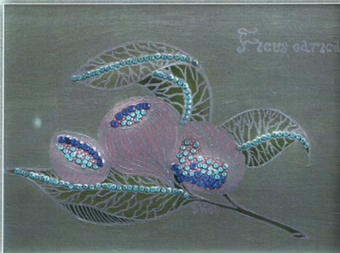
„Смокиня” - “Ficus Carica” Дърво, акрил, кристали, 2009 г., 20 x 15 см Wood, acrylic paint, crystals, 2009, 20 x 15 cm

Морис Метерлинк (1862 – 1949 г.): „Разумът на цветята”, белгийски поет, драматург, есеист. Носител на Нобелова награда – 1911 г.