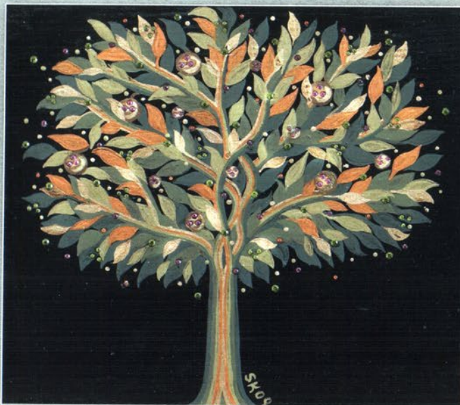
“Дървото на желанията” - “The tree of desires” Дърво, дзифт, акрил, кристали, 2009 г., 21 x 19 cm Wood, black resin, acrylic paint, crystals, 2009, 21 x 19 cm

Сред дървесата има две, които аз си измислих. Когато се ровех в старите книги, не открих легенда или мит, които биха ме насочили да следвам намерението си. Предлагам ги на Вашето внимание: „Дървото на мечтите” и „Дървото на желанието”. Та нали ние всички имаме и мечти и желания? Някой ще каже – нима това не е едно и също? Мисля, че не е „едно и също”. По скоро можем да осъществим желанията, но мечтите винаги трябва да са пред нас, даже и тогава, когато е трудно да се превърнат в желания.