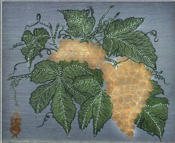
„Грозде” - “Grape Vine” Дърво, акрил, кристали, 2006 г., 30 x 25 см Wood, acrylic paint, crystals, 2006, 30 x 25 cm