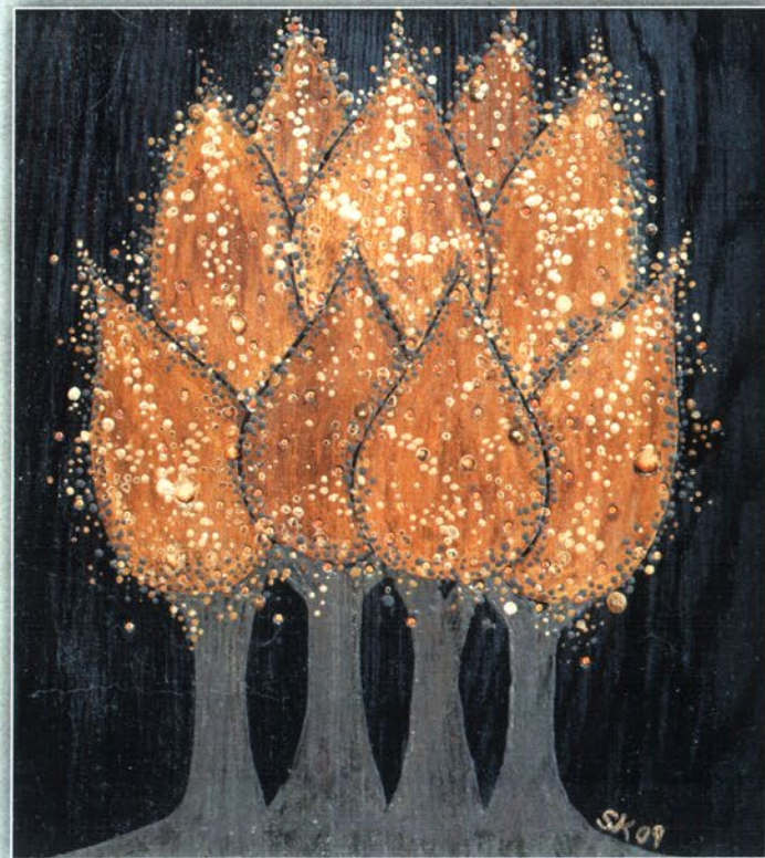
„Гората на познанието” - “The forest of knowledge” Дърво, дзифт, акрил, кристали, 2009 г., 21 x 19 см Wood, black resin, acrylic paint, crystals, 2009, 21 x 19 cm